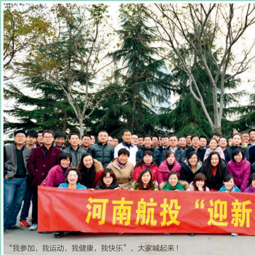
“我参加，我运动，我健康，我快乐”，大家喊起来！

本刊讯 12月24日下午3点，随着一声哨响，郑东新区如意湖边的广场上喊声骤起：“物流，加油！”“党群，冠军！”一场热闹非凡的拔河比赛拉开帷幕，这是河南航投2014“迎新年”文体活动中的一个镜头。台球、乒乓球、跳棋、双升、健步走及拔河6大比赛项目，相继展开。